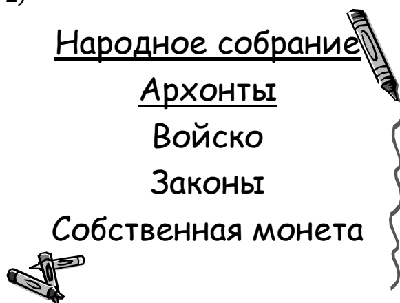
Рис. 2. Работа с понятием «колония»