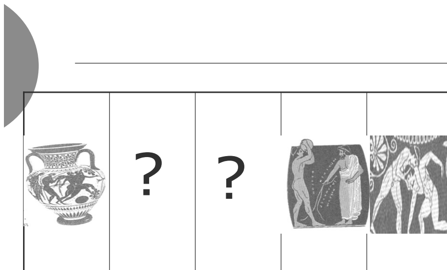
Рис. 6. Виды состязаний