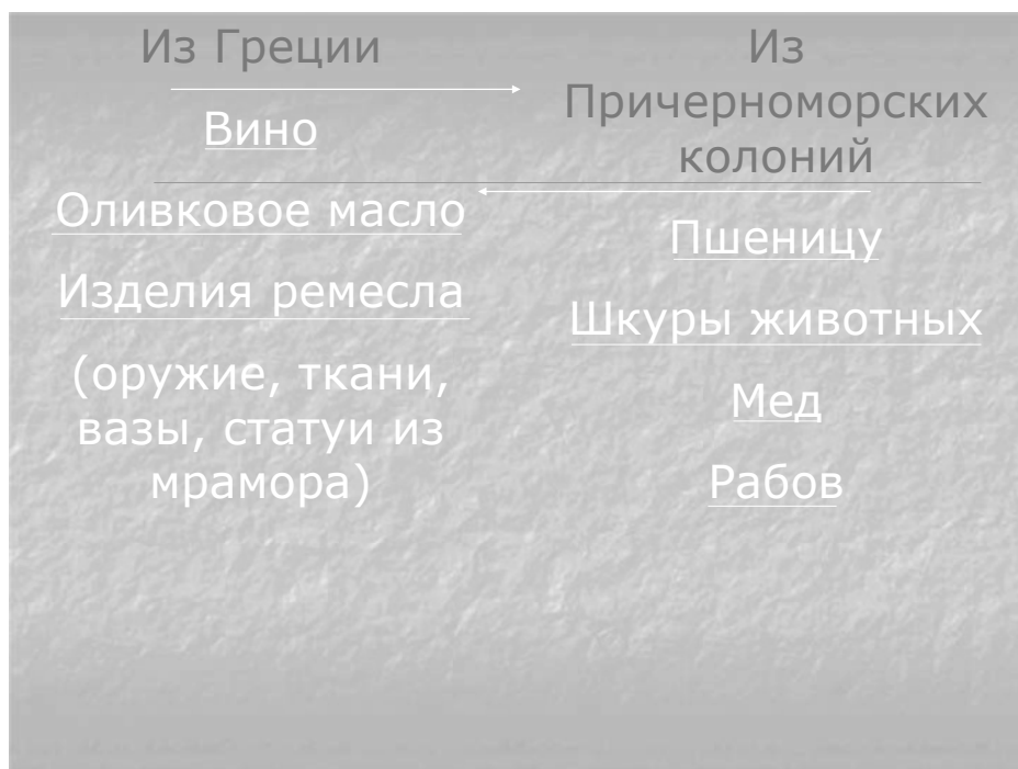
Рис. 4. Импорт и экспорт в Древней Греции