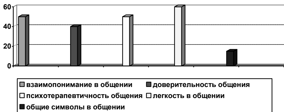
Рис. 2. Средние показатели особенностей общения в супружеской паре

Общение в семьях данной группы носит весьма доверительный характер. Однако женщины считают, что мужа менее доверяют им в процессе общения.