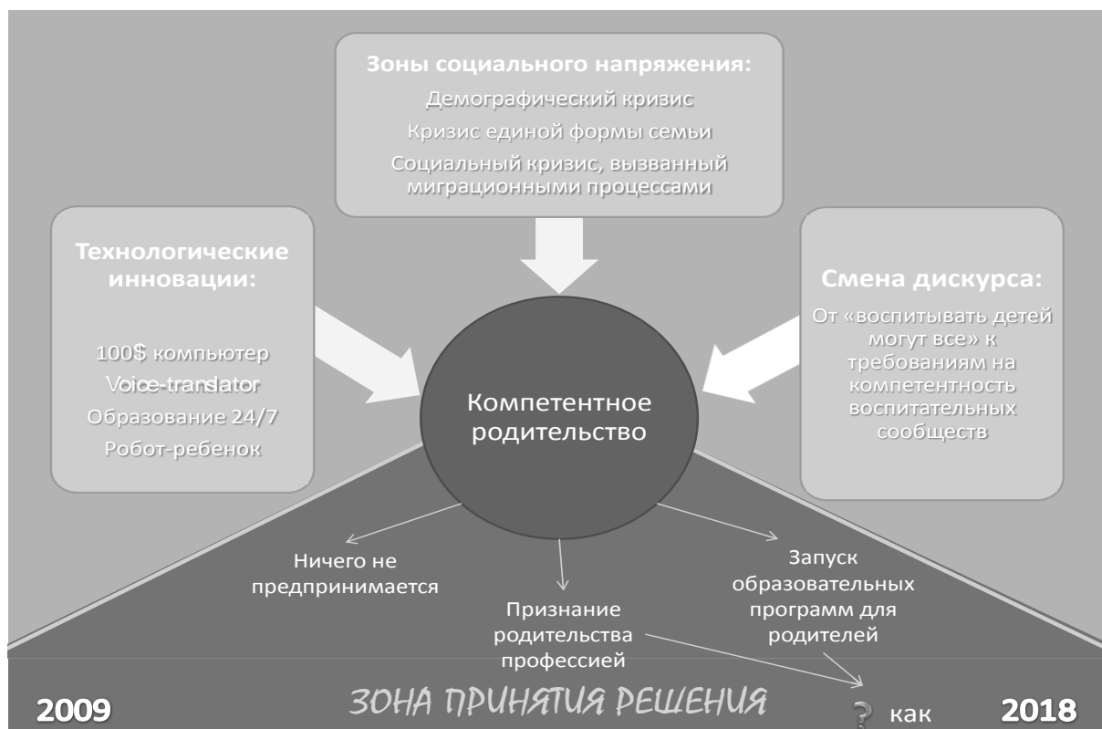
Рис. 6. Фрагмент дорожной карты «Детство-2030»: инновационные концепты, отвечающие на вызовы будущего

Закономерно, что система действий предусматривает специфические, аутентичные идеи, которые поступательно проводятся через весь Проект. В этом смысле идея семьи – всех аспектов, связанных с ее бытием и функционированием, – не оказывается исключительно авторской. Действительно, инновационно-новаторской предстает идея о компетентном родителстве.