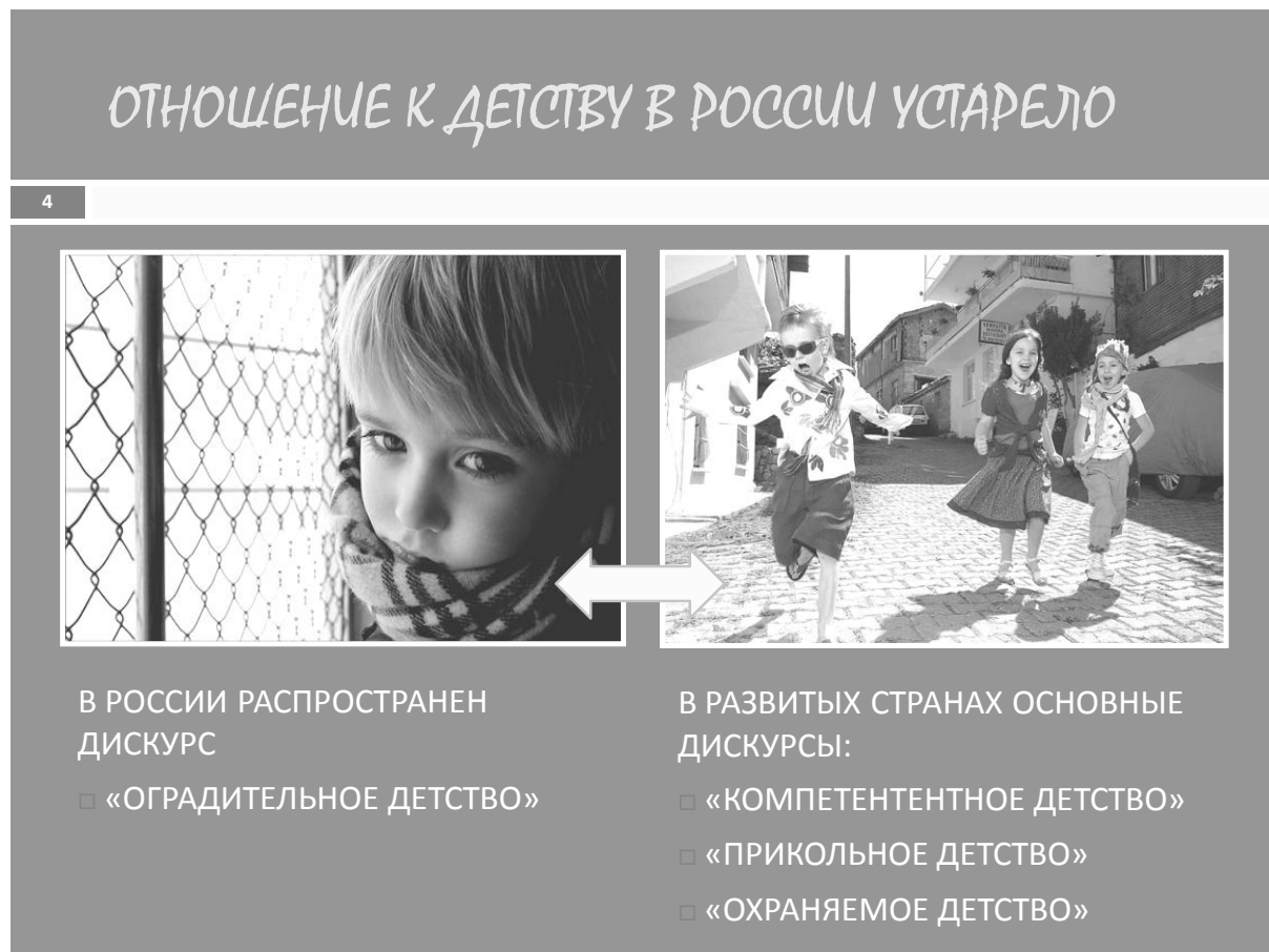
Рис. 2. Фрагмент дорожной карты «Детство-2030»: создание неоднозначно-контрастного образа прошлого и настоящего

Иными словами, формулируется не просто описание эпохи (настоящее – прошедшее – будущее), но именно ее качественная характеристика, которая в логике идеологии Проекта имеет ярко негативный модус.