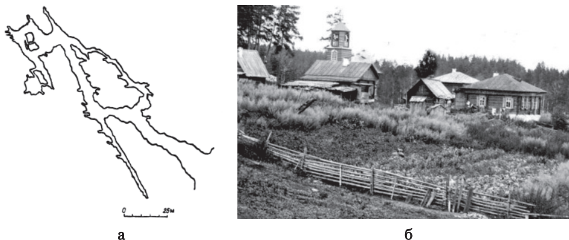
Рис. 1. а – план Игнатьевской пещеры; б – монастырь озера Кысыкуль

Лесные монастыри в планировочном отношении не отличались регулярностью, а большинство строений напоминало крестьянские избы с необходимыми культовыми дополнениями. Некоторые монастыри были, скорее, небольшими поселениями, куда переселялись отдельные семьи старой веры. Например, монастырь, находившийся на территории лесной дачи Нижнетагильского завода около Учинского болота. Поселенцы этого монастыря соблюдали обряды, но также занимались пчеловодством, земледелием, охотой [4, д. 2264]. На территории Миасского завода около озера Кысыкуль был женский монастырь. Он представлял собой открытую территорию среди леса, на которой располагалось несколько деревянных изб. Одна из них представляла собой молельню и имела колокольню [6, д. 441]. Сохранилась фотография этого монастыря, по которой можно представить себе характер его архитектуры. Застройка включает хаотично расположенные срубные избы (рис. 1, б).