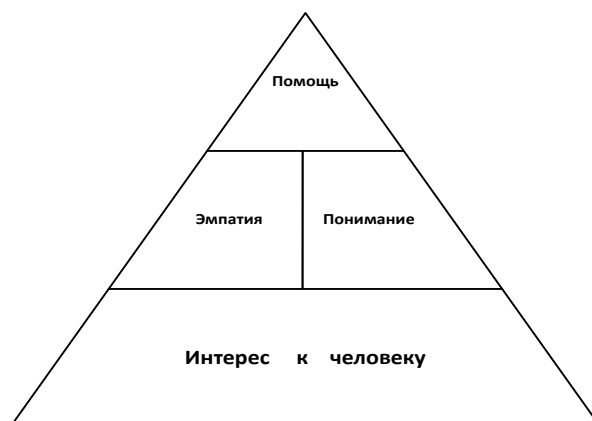
Рис. 1. Структура сензитивности к человеку

Итак, мы выделили четыре компонента, которые в своей совокупности составляют структуру сензитивности к человеку (см. рис. 1).