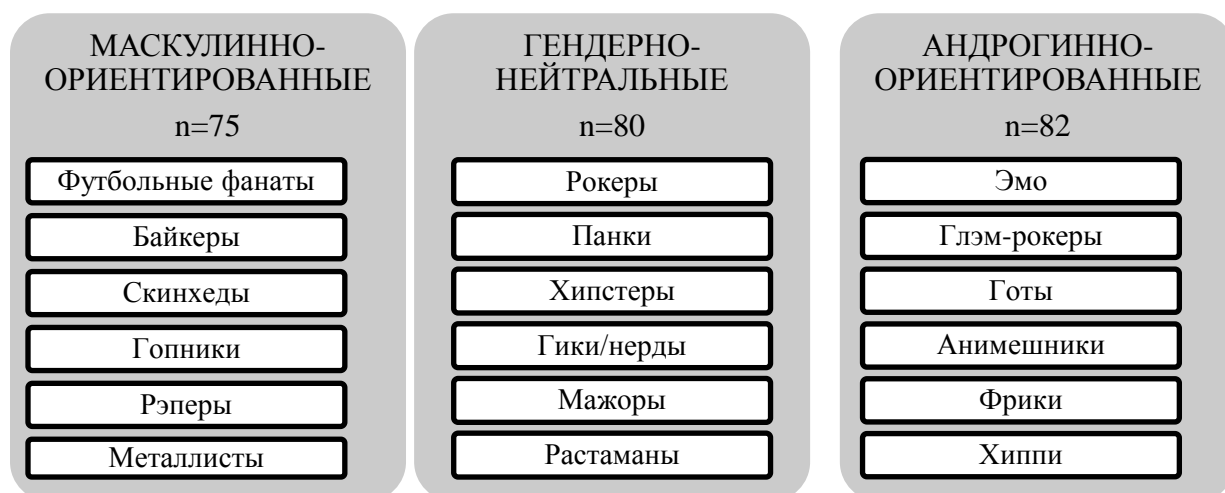
Рис. 1 – Типология современных субкультур

Говоря о личностных характеристиках , ярко прослеживается дифференциация по таким категориям как толерантность, уровень авторитарности, тип личности, сексуальная ориентация, половозрастная структура.