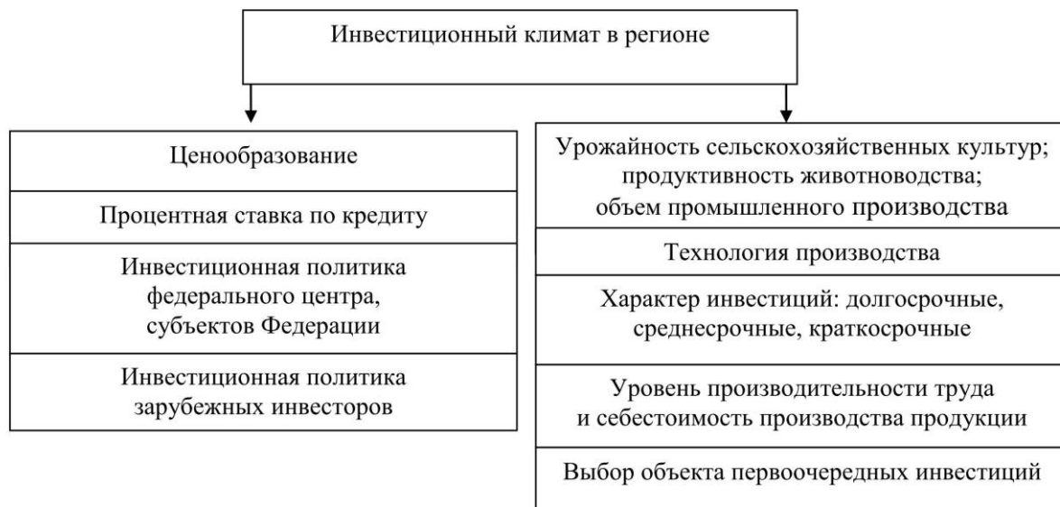
Рисунок 2 – Факторы, влияющие на привлечение инвестиций в регионе

вия, определяющие влияние внутренней и внешней среды (рис. 1).