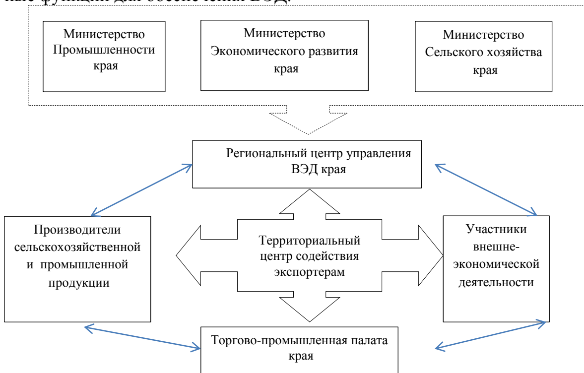
Рисунок 1 – Примерная структура координации управления ВЭД на уровне региона

В круг задач Территориального центра содействия экспортёрам входит создание нормативно-правовой и информационной базы, регулярное обновление и развитие информационных ресурсов, развитие сферы и номенклатуры услуг центра, привлечение к консультированию работников научных и образовательных организаций края. В целом, механизм управления ВЭД на региональном уровне должен содержать систему государственных, рыночных и общественных институтов, реализующих различные функции для обеспечения ВЭД.