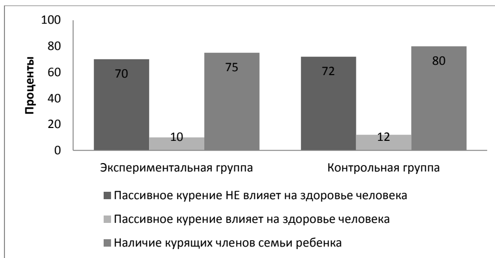
Рис. 1. Определение уровня знаний о табакокурении

Результаты анкетирования «Определение уровня знаний о табакокурении» наглядно представлены на рисунке 1.