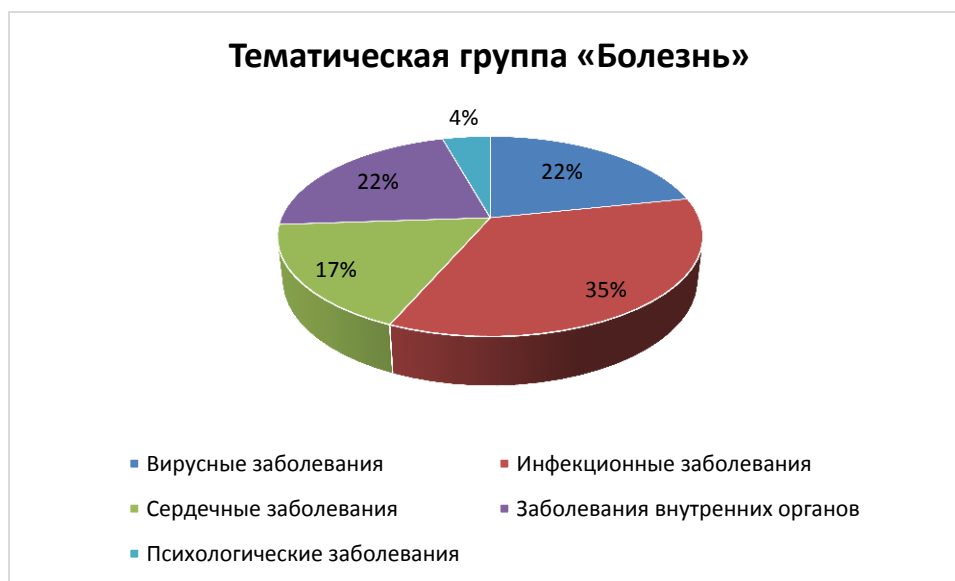
Рис. 2. Тематическая группа «Болезнь» (Г. Зотов «Сказочник»)

ных с сердечной недостаточностью: инфаркт, инсульт, разрыв аорты, закупорка сосудов и пр. (см. рис. 2).