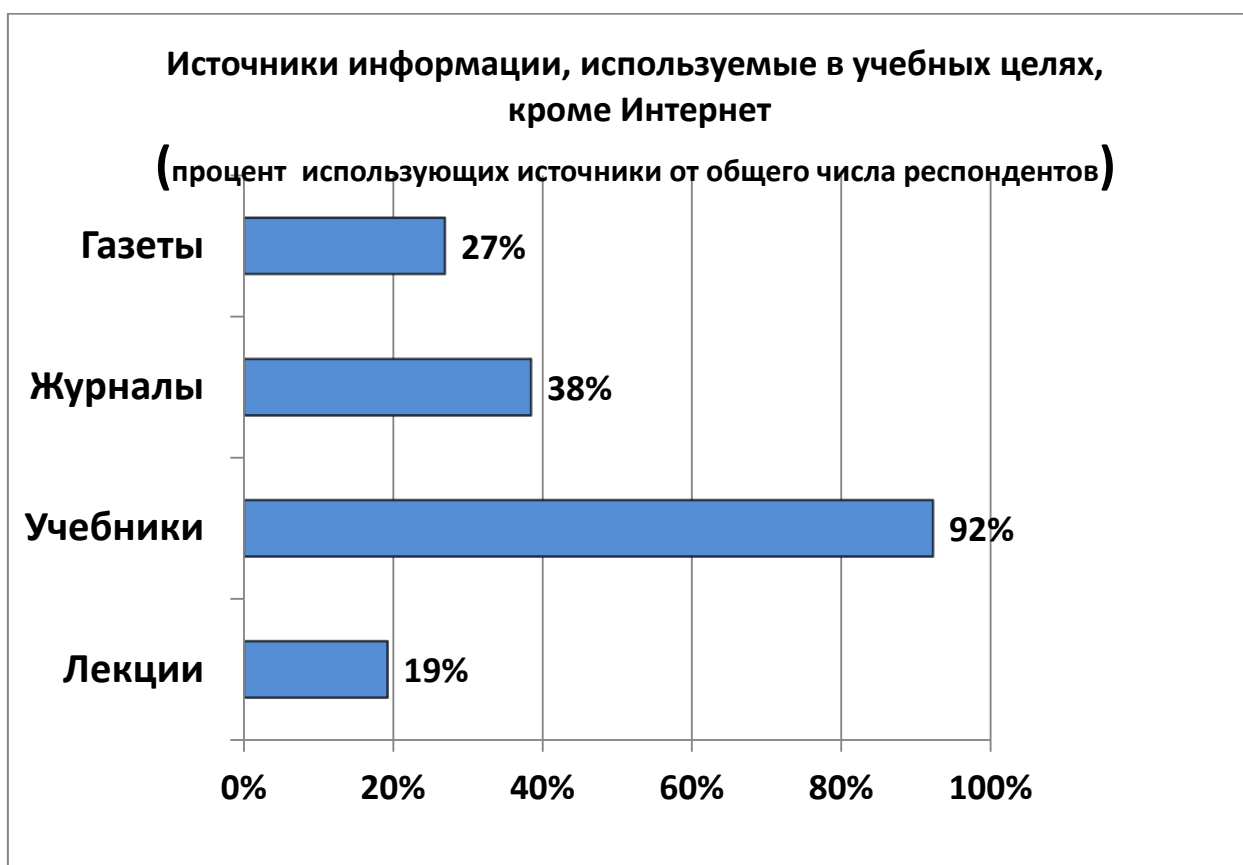
Рис. 2. Источники информации, используемые студентами в учебных целях

В среднем по всем группам студенты более всего используют учебники для решения своих учебных задач (92 % опрошенных). Следует обратить внимание на тот факт, что по всем группам, независимо от курса, пола и места проживания менее всего студенты используют лекционный материал (19 % опрошенных, и почти все они – девушки), рис. 2.