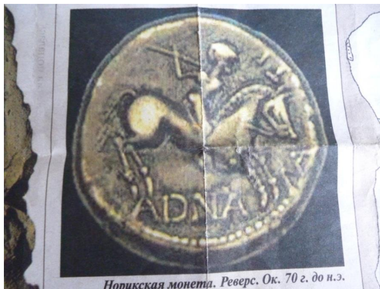
Рис. 3. Фото серебряной монеты. Около 70 г. до н.э. [1]

Изображение Норикской монеты мы взяли из статьи Андрея Воронцова «Тайна Графенштайнской надписи», опубликованной в 2012 году [1]. На реверсе нарисован конь с всадником и есть надпись, идущая слева направо. Внизу читается слово АДНА, сбоку ЛАТИ. Слог ЛА написан до морды коня, а слог ТИ – после. Перед нами монета номиналом в АДНУ ЛАТИ. Мы, кстати, так и произносим АДНА. А. Воронцов читает АДНА МАТИ, т.е. ЕДИНАЯ МАТЬ и предполагает, что это означает Родина – мать или Отчизна. Мы тоже сделаем ряд предположений. Известно, что норики верили в Марса – Латобия (было норикское племя латобики) [1], поэтому на коне может сидеть Марс – Латобий, и в честь него названа денежная единица. Похожее название денежной единицы, «лат», в настоящее время имеется в Латвии. Но на норикской монете написано ЛАТИ, возможно, это уменьшительная, ласкательная форма, подобно словам МАТИ, АПИ (Апа), ТЕСИ (Теса), ЕЗИ (бог). Слово «лата» есть во всех славянских языках в значении «кровельная планка, дранка» и «заплата»; «латать кровлю», «латать дыры на одежде»; латы – «панцирь из пластинок, нашитых на кожу» [8]. То есть, «лата» – это предмет из любого материала (дерево, ткань, металл), любой формы (круглой, продолговатой) и небольшого размера. Маленькую, круглую монету из серебра называли уменьшительно ЛАТИ.