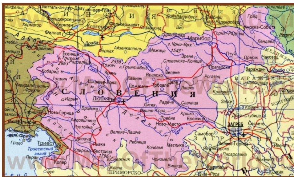
Рис. 1. Карта Словении и Каринтии. Птуй на Драве расположен на северо-востоке Словении, к юго-востоку от Марибора; Графенштайн находится в Австрии, в Каринтии, на карте совпадает с Клагенфуртом

Keywords: Norik language; inscription from Ptuj; Norik coin; Slavic language; god Ruevut (Ruevit).