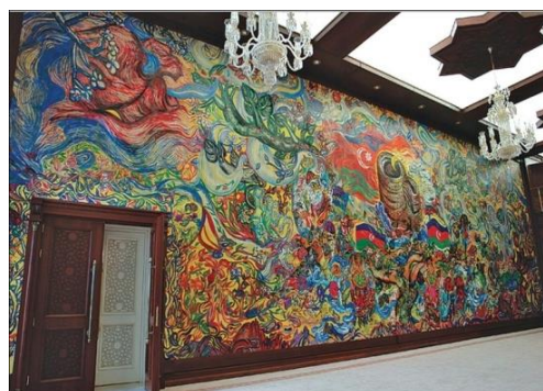
Рис. 9. Панно «Цвети, край родной!», украшающее интерьер здания Милли меджлиса АР (1980)

Выдающийся художник, обладающий высоким профессионализмом, имел успех во всех жанрах изобразительного искусства. Блестящие произведения, созданные им в различных жанрах – пейзаж, портрет, монументальная живопись, иллюстрация и театральная живопись, обладают жанровым разнообразием, эстетическим совершенством и своеобразным стилем.