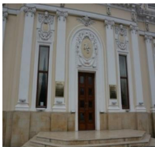
Рис. 2. Азербайджанский Кукольный театр им. А. Шаига

дыхание, подарив зрителю радость и сегодня созерцать это уникальное произведение Тогрула Нариманбекова.