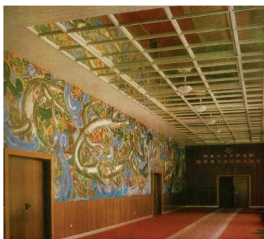
Рис. 6. Фрагмент фрески в бывшей гостинице "Москва"