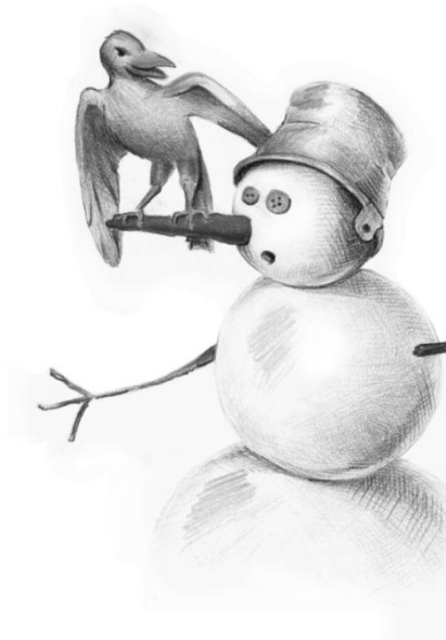
Рис. Лады Киреевой

И к нему мы рванули бегом, Проявляя ребячью сноровку. Отогнали ворону снежком И покрепче воткнули морковку.