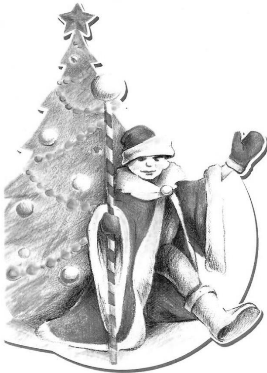
Рис. Лады Киреевой

Что галдите вы напрасно, Кто главней из вас... Друзья! И без споров это ясно, Самый главный – это Я!»