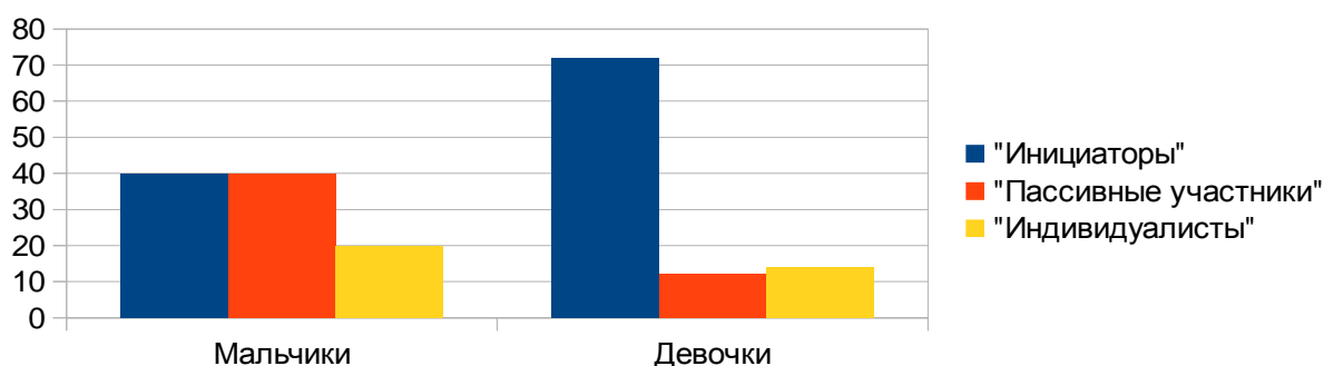
Рис. 1. Результаты исследования развития сферы общения со сверстниками

Количественный и качественный анализ результатов показал, что средний уровень развития общения («пассивные участники») имеют 40 % мальчиков и высокий уровень («инициаторы») так же 40 %. Категория мальчиков с низким уровнем («индивидуалисты») – 20 % опрошенных. У девочек же высокий уровень составляет 72 %, средний – 12 % и лишь 14 % девочек имеют низкий уровень развития сферы общения со сверстниками (рис. 1).