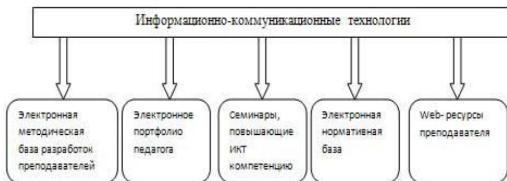
Рис. 1. ИКТ в формировании и совершенствовании деятельности педагога

Обладая ИКТ-компетентностью, современный педагог моделирует и конструирует информационно-образовательную деятельность. Каждый новый день перед педагогом ставит новые задачи. В современном мире важнейшая задача учителя научить подрастающее поколение жить в информационном обществе, уметь выбирать и использовать знания, необходимые для работы.