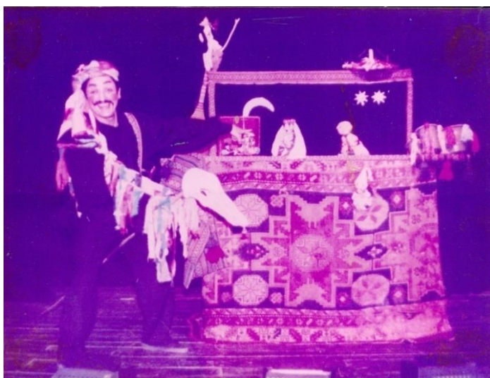
Рис. 1. Сцена из спектакля «Свадьба лысого», реж. Р. Ализаде, худ. С. Хаквердиева (1993)

зрелище были также, популярны к примеру: «Вертеп» – на Украине, «Батлейка» – в Белоруссии, «Палван Качаль» – у узбеков. В основном эти спектакли были многочастевый драмы, построенные на идентичных мотивах, что и кукольное представление «Килим-арасы». Все эти представления отражали самобытную культуру своего народа. Однако, вернемся к характеристике азербайджанского театрального представления «Килим-арасы». Действие в нем развивалось с калейдоскопическим переплетением различных форм фольклорного искусства, а само представление развивалось посреди ковра, когда кукловод, прикрытый краями килима, который поддерживал его помощник, лежа на спине, с помощью рук и ног управлял марионетками. Куклы для такого спектакля изготавливались из различных видов ткани. В сельских местностях Азербайджана были широко распространены перчаточные представления «Килим-арасы».