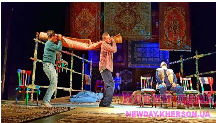
Рис. 2. Сцена из спектакля с участием ковра-Килима

жанры площадного театра – «Каравелли» (жанр комических анекдотов), «Орта Оюну» («Игра в середине» – представление в центре зрелищной площадки), «Кечал и Кеса» (Лысый и Безбородый) – своеобразные юмористические представления с постоянными персонажами – масками, а также своеобразные кукольные представления. Однако, не всегда эти представления были юмористические и комические, были и такие которые носили религиозный характер, а также те, которые представляли трагическую форму зрелищного искусства, в которых ковер выступает как неотъемлемый религиозный атрибут. Одним из таких явлений были религиозные мистерии «Шебих», в которых воссоздавались сцены мученической смерти исламских шейхов. Совершенно невозможно сказать, что первично – жизнь симитировала искусство или наоборот, – но прием с выносом «мертвого» актера со сцены в ковре широко использовалась в театре и в кино [2]. Оказывается, в этом есть практический смысл, благодаря нему, можно без лишнего привлечения внимания, перемещать по сцене людей, завернутый в плотный ковер актер был ограничен в движение, а также был застрахован от непредвиденных неуправляемых эмоций. Именно эти моменты на сцене удачно прикрывал ковер!