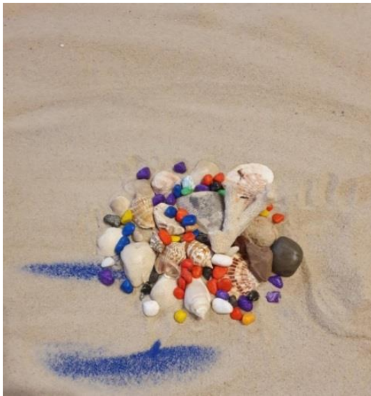
Նկ.1. Տեխնիկա «Խխունջների կղզին»

Ներկայացված աշխատանքում այցելուն 20 տարեկան աղջիկ է, որի մոտ առկա են հակառակ սեռի հետ հարաբերություններով պայմանավորված տագնապային վիճակներ, արտամղված սեռական պահանջմունքներ: Ավագի վրա պատկերում ակնհայտ արտացոլվում են արական ու իգական սեռական սիմվոլիկա կրող առարկաները, որոնց դասավորվածությունը հուշում է այցելուի մոտ առկա խառնաշփոթի մասին: Իր համար գլխավորը սեռականության հետ կապված հույզերն ու ապրումներն են, ամենակարևորը արականության սիմվոլն է, որն ավագե պատկերի ամենակենտրոնում է տեղադրված: Ամբողջը խառնաշփոթի մեջ է, չհամակարգված ու անկանոն: Ընդ որում, նա նշում է, որ կղզին օվկիանոսի վրա լողում է, ամուր հիմքեր չունի, իսկ տրանսֆորմացիոն հարցերին այն մասին, թե ինքը ինչ կավելացներ, ինչ կփոխեր և արդյոք կա մի բան, որ իրեն դուր չի գալիս, պատասխանեց, որ իրեն դուր չի գալիս այն, որ կղզին միայն խխունջներից է կազմված և լողում է, կուզեր, որ այն ավելի ամուր լիներ: Հարցին, թե ինչպես կարելի է այն ամրացնել, պատասխանեց, որ դա հնարավոր կլիներ, եթե քարեր լինեին: Մեր կողմից առաջարկ եղավ բնական քարերի օգտագործմամբ ամրացնել կղզին, ինչը և արվեց այցելուի կողմից: Սակայն հարցին, արդյոք քարերի ավելացումից հետո կա այդ զգացողությունը, որ կղզին ավելի ամուր է, այցելուն պատասխանեց, որ ոչ թե զգացողություն է, այլ թվում է, որ այդպես է: Ավելի ամուր հիմքեր ունենալու այցելուի ցանկությունը և հարաբերություններում ստեղծված խառնաշփոթը հաղթահարելու անհրաժեշտությունը մեզ ոգեշնչեց այս տեխնիկայի կիրառման երկրորդ փուլին, ինչը և ներկայացնում ենք ստորև: