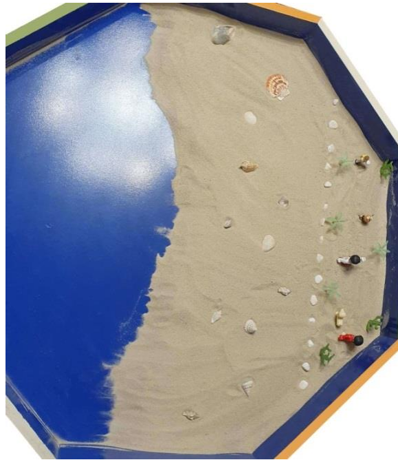
Նկ. 2. Տեխնիկա «Մխունջների կղզին» II հանդիպում

Երկրորդ հանդիպման ավարտին այցելուի մոտ ամրապնդվել էր կղզու՝ ամուր հիմքեր ունենալու զգացողությունը, շատ բան ավելի որոշակի էր դարձել, հարաբերություններում առկա խառնաշփոթի հետ կապված որոշ մտքեր ու զգացողություններ էին ի հայտ եկել: