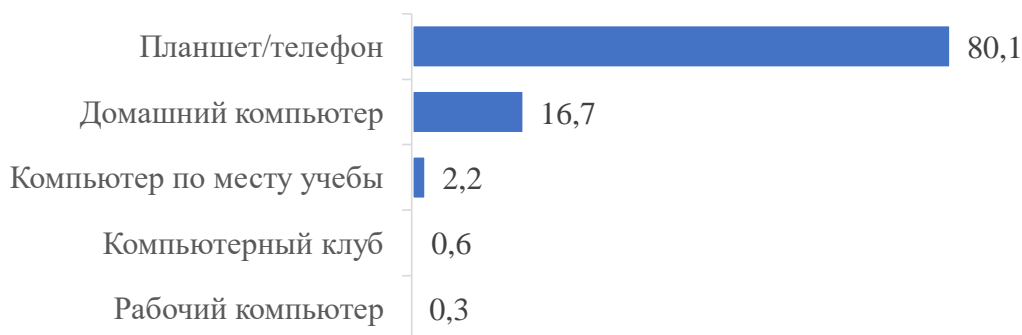
Рис. 2. Через какое устройство Вы обычно пользуетесь Интернетом? (закрытый альтернативный вопрос, % от числа ответивших)

почитают пользоваться Интернетом с помощью мобильных устройств, а не с помощью стационарных компьютеров с полноценным рабочим функционалом (см. рис. 2). Конечно, такая привычка «цифровых аборигенов» пользоваться Интернетом именно с помощью мобильных устройств совсем не отменяет перспектив использования Интернета для их обучения: очевидно, что соответствующие задачи могут решаться и с помощью мобильных устройств. Тем не менее, такая привычка осложняет решение этих задач и требует поиска более гибких подходов: ограниченный функционал мобильных устройств делает их явно менее удобными для трансляции образовательного контента. Соответственно, мы можем отметить, что устоявшиеся у «цифровых аборигенов» привычки использования Интернета скорее осложняют его использование для обучения, а не благоприятствуют ему.