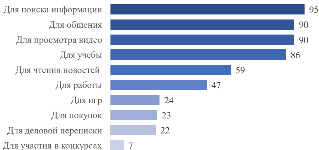
Рис. 1. Для чего Вы чаще всего пользуетесь Интернетом? (поливариантный вопрос, % от числа ответивших)

Второй вывод. Запрос на использование Интернета для обучения среди «цифровых аборигенов» есть, но выражен относительно слабо. Собранные опросные данные в этом смысле дают довольно противоречивую картину. С одной стороны, обучение не входит в перечень наиболее важных целей, ради которых опрошенные пользуются Интернетом: на первых местах по популярности оказываются поиск информации, общение и просмотр видео. С другой стороны, доля тех, кто использует Интернет именно для обучения, среди опрошенных также оказалась довольно велика (см. рис. 1) Столь противоречивая картина говорит о том, что обучение на данный момент не является главной целью, ради которой опрошенные пользуются Интернетом, но все же базовая идея о том, что в Интернете можно не только общаться и развлекаться, но и учиться чему-то новому, большинству респондентов знакома. Фактически это тоже говорит о том, что определенный запрос на использование Интернета в процессе обучения у «цифровых аборигенов» сло-