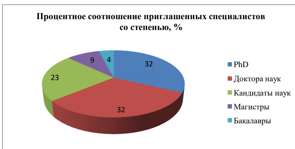
Рис. 3. Качественный состав зарубежных привлеченных специалистов в 2020 году Составлено на основе источника [1]

Длительность преподавания зарубежных специалистов в вузах – от 4 до 120 дней. Качественный состав зарубежных привлеченных специалистов представлен на рис. 3.