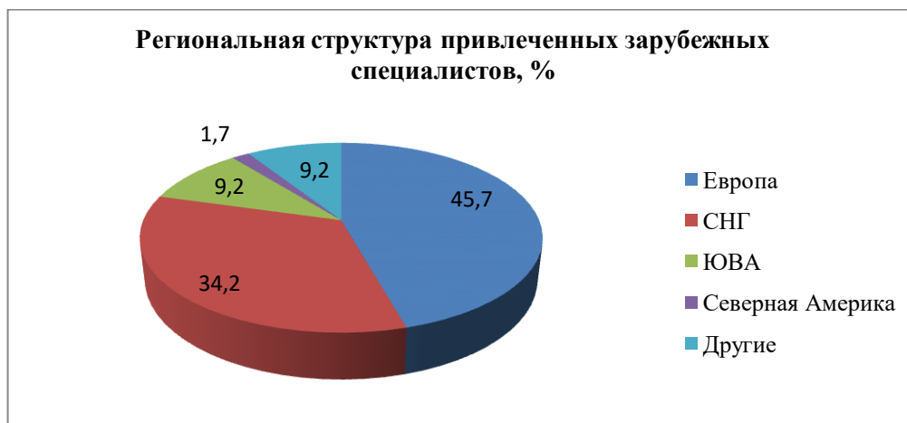
Рис. 1. География привлеченных зарубежных специалистов в 2019 году Составлено на основе источника [2]

В 2020 году за счет внебюджетных средств привлечено в преподавательскую деятельность 270 зарубежных специалистов (в 45 вузов). Из них национальными университетами – 78, вузами со статусом Некоммерческих акционерных обществ – 95, Акционерных обществ – 43, частными университетами – 54 человек. По сравнению с 2019 годом произошло снижение на 77,4 %. В 2019 году за счет внебюджетного финансирования привлечены в преподавательскую деятельность 479 зарубежных специалиста: национальными вузами – 157, государственными – 47, акционированными – 90, частными – 185 [1].