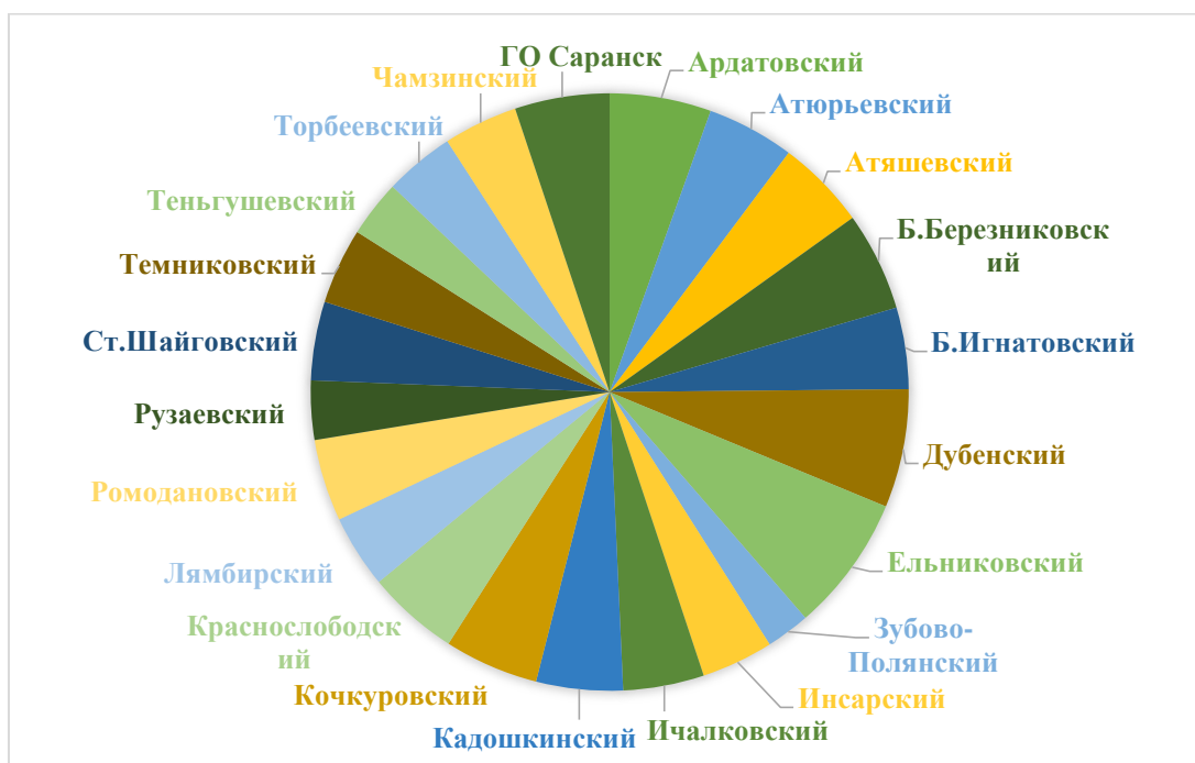
Рисунок 1. Онкологическая заболеваемость в Республике Мордовия (2020 г., по данным Мордовиястат)

Ежегодный рост заболеваемости в регионе медики объясняют совершенствованием методов диагностики и получением нового оснащения для онкодиспансера.