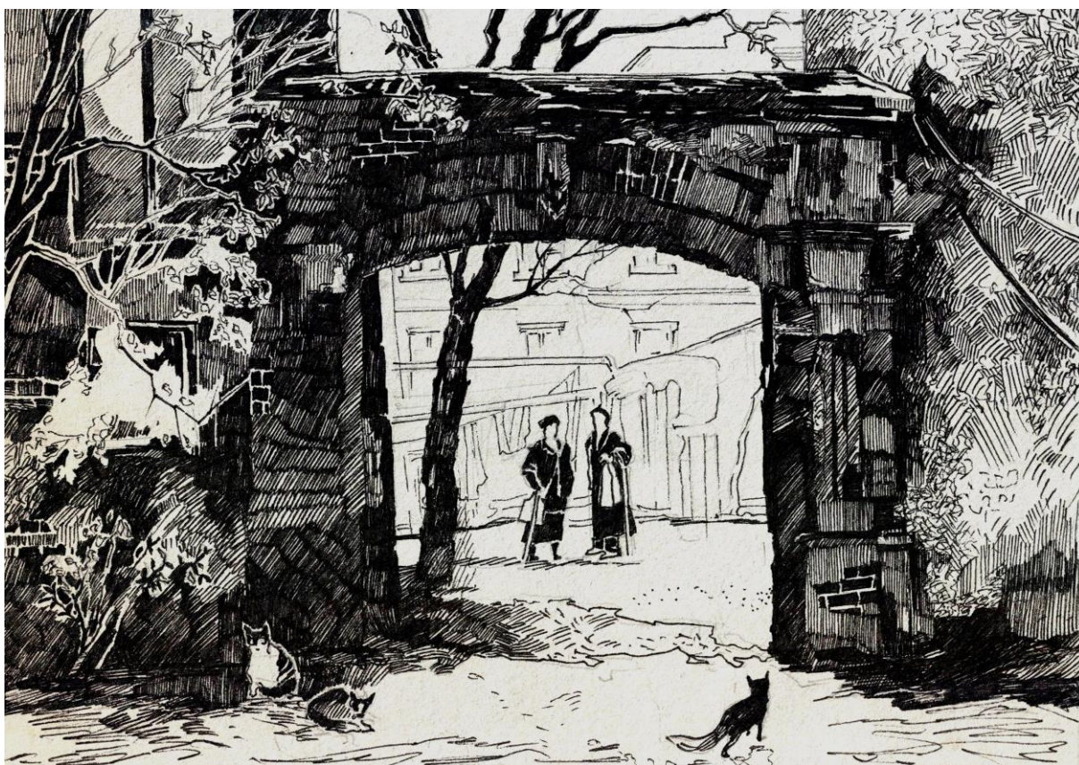
Дворик. Автор Татьяна Белозёрова

Искать дом-«скворечник» на Автоматном переулке, 9, где жила наша семья в 60-е годы, незачем, вместо него над травяной путаницей стоит одинокая черёмуха.