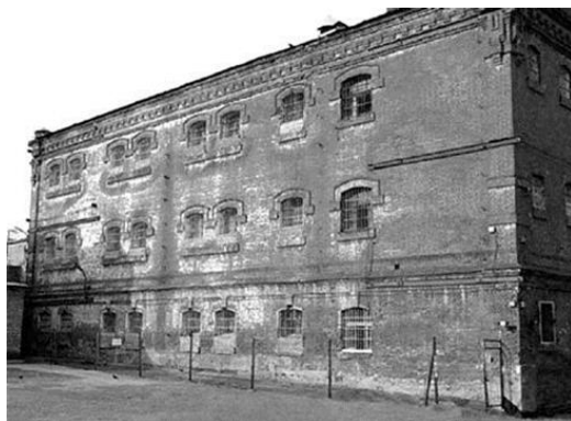
Корпус Пензенской губернской тюрьмы