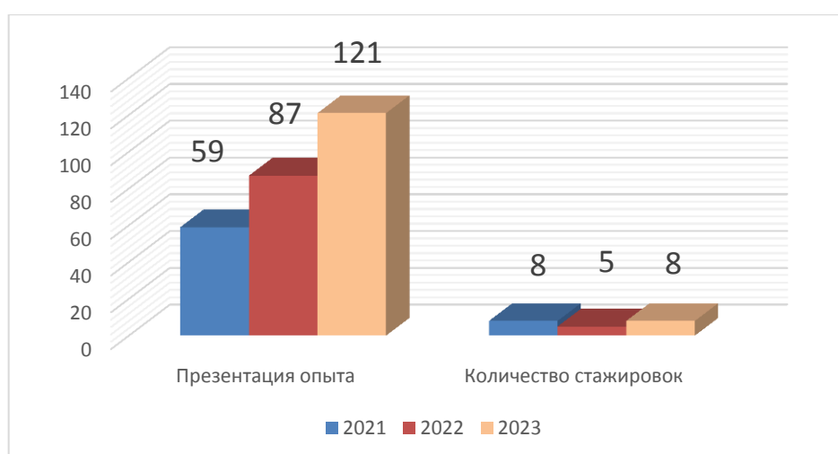
Рис. 2. Информация по распространению эффективного опыта и успешных практик

Кроме того, наблюдается увеличение числа педагогических работников и управленческих кадров, распространяющих лучшие практики на базе Отделения и под руководством его сотрудников.