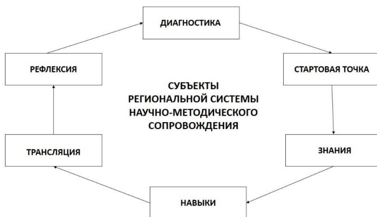
Рис. 1. Непрерывный цикл совершенствования профессионального мастерства

Первым этапом является диагностика, которая включает следующие формы: