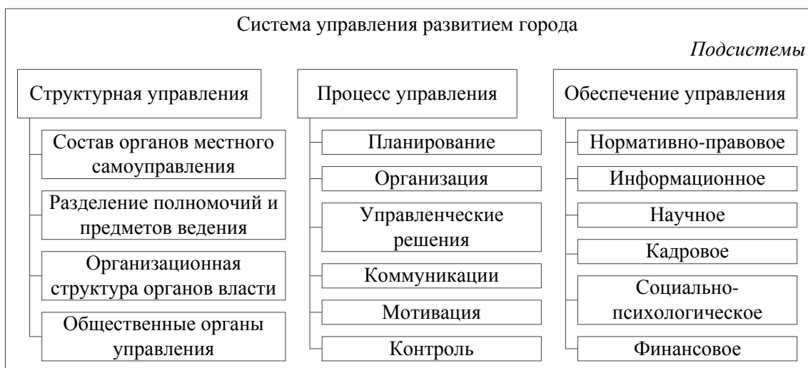
Рис. 3. Структура системы управления развитием городских территорий

Следовательно, можно утверждать, что предметом анализа и оценки системы управления комплексным развитием города является элементный состав субъекта управления и содержательные характеристики механизма управления, под которым мы понимаем взаимодействие субъекта и объекта управления через совокупность функций и методов управления вместе с обеспечивающим аппаратом их реализации (рис. 3).