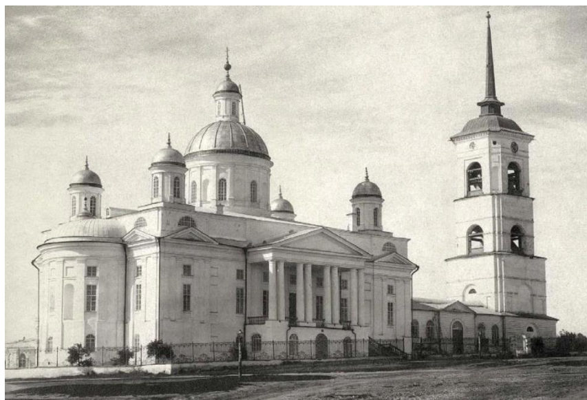
Пензенский кафедральный собор

«НЕТ» означает отрицание канонов Веры православной и традиционных – единых конфессий.