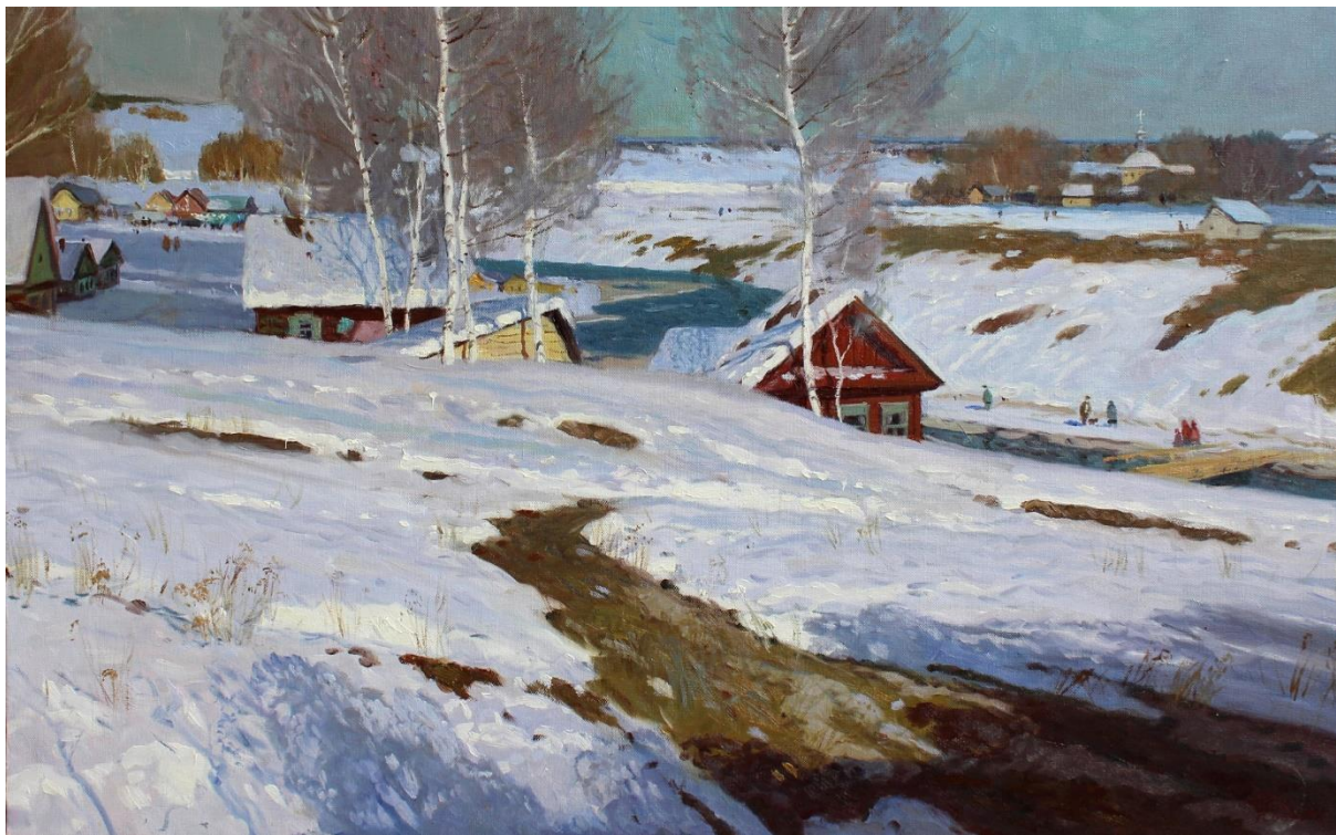
Валерий Копняк. Зимний пейзаж